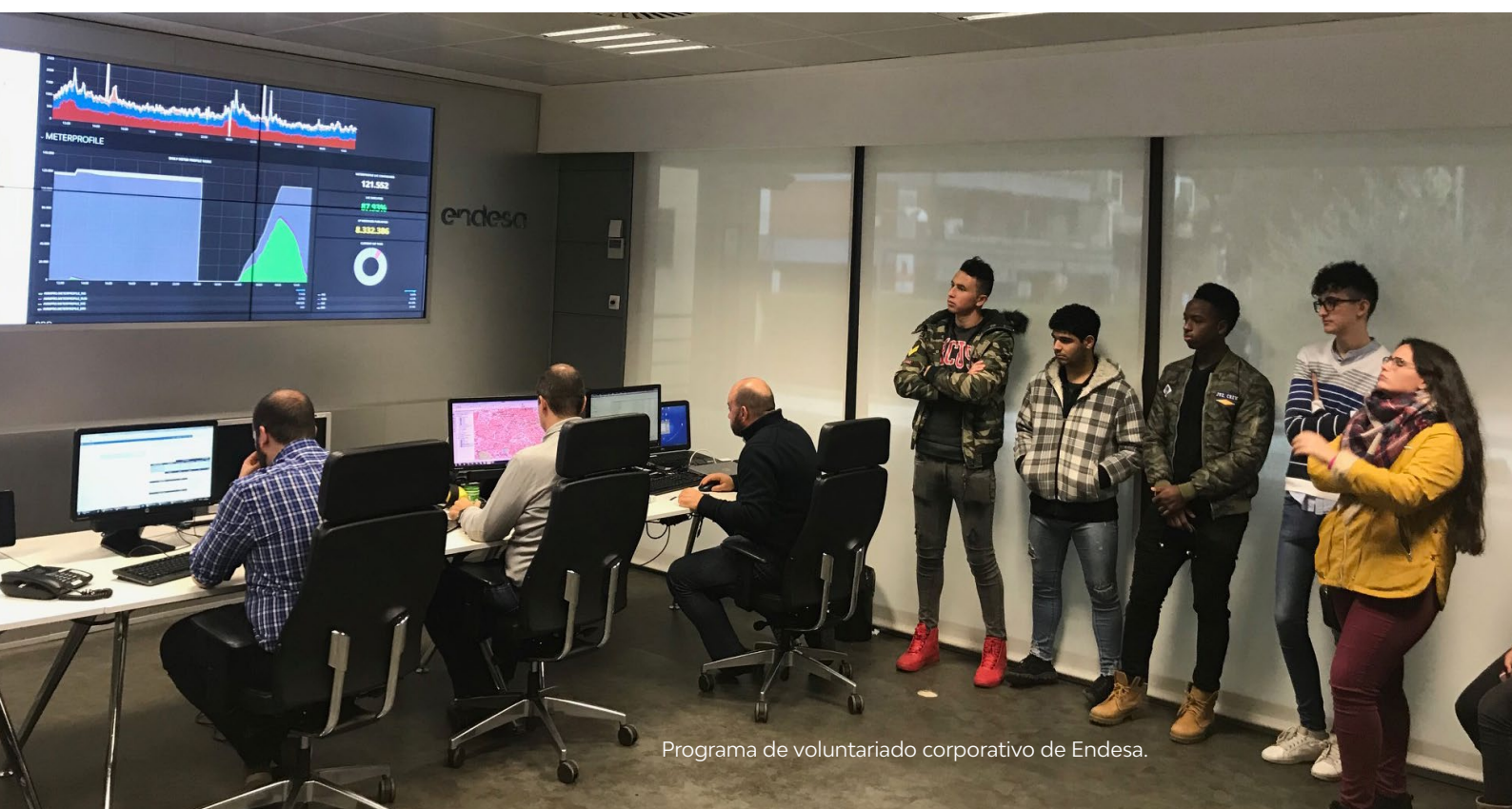
Programa de voluntariado corporativo de Endesa.