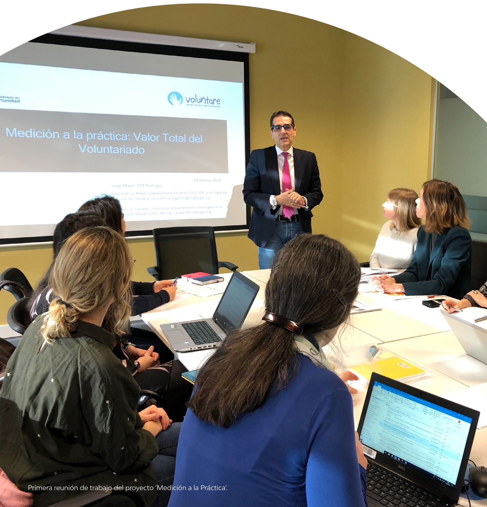
Primera reunión de trabajo del proyecto 'Medición a la Práctica'.