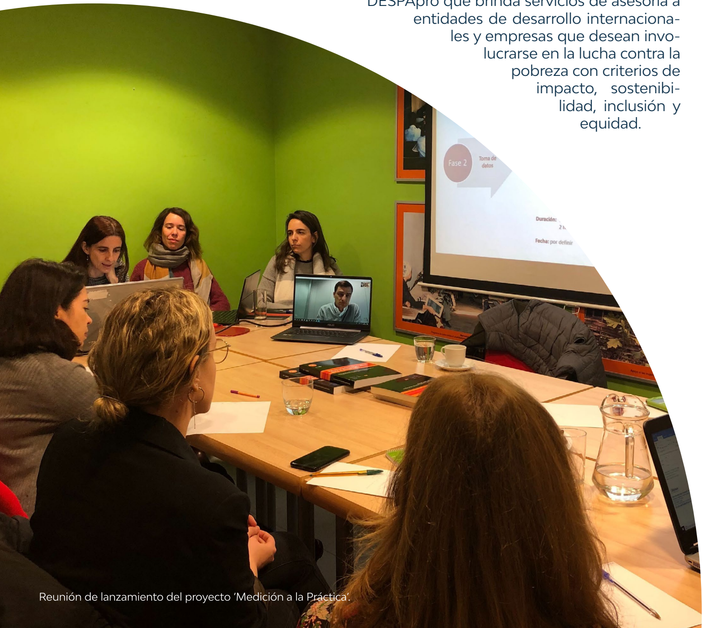
Reunión de lanzamiento del proyecto 'Medición a la Práctica'.

Cuenta con un Área de Consultoría en Desarrollo CODESPApro que brinda servicios de asesoría a entidades de desarrollo internacionales y empresas que desean involucrarse en la lucha contra la pobreza con criterios de impacto, sostenibilidad, inclusión y equidad.