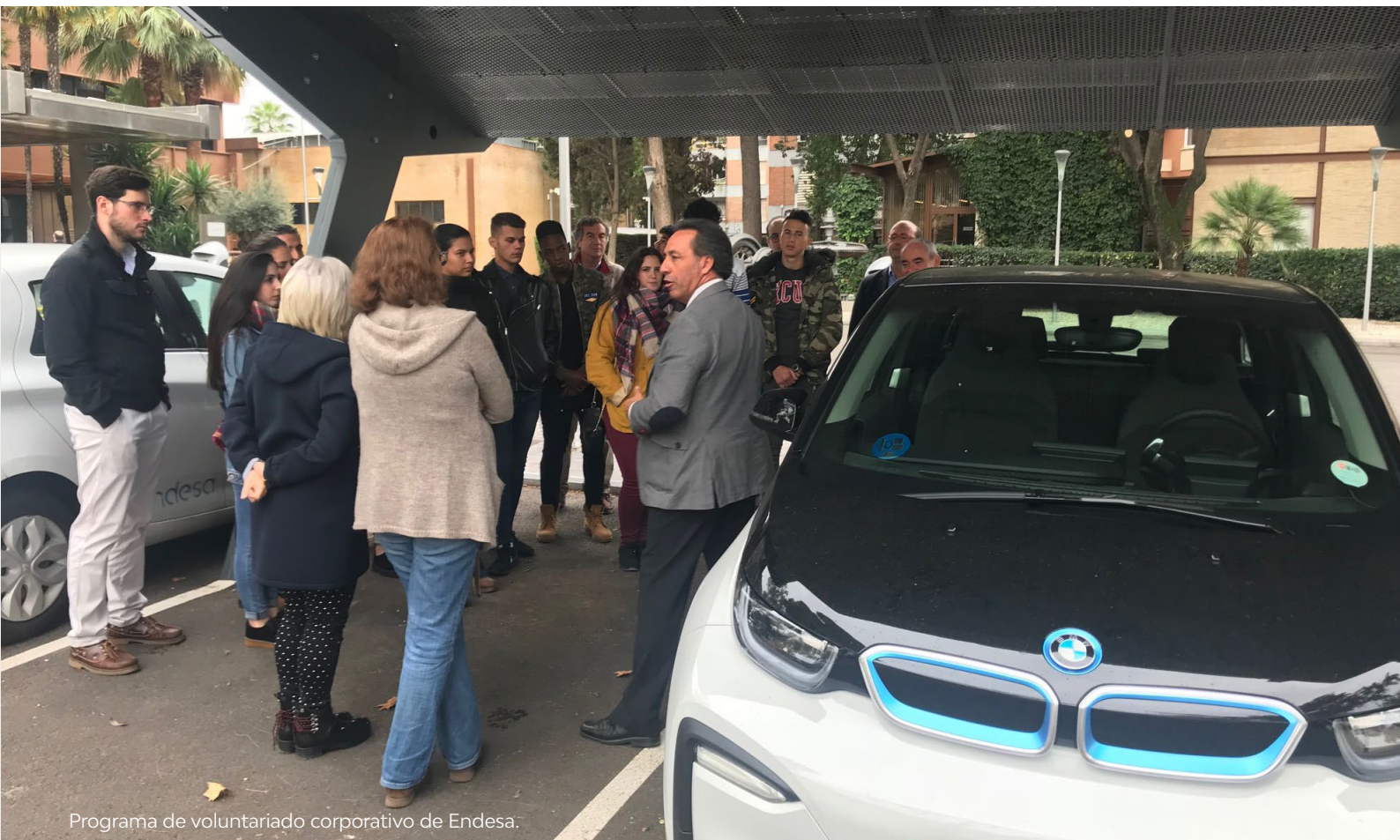
Programa de voluntariado corporativo de Endesa.

que es muy importante o absolutamente esencial que las empresas actúen de manera socialmente responsable (The Social Market Foundation, 2010).